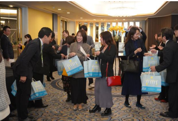
コミュニケーション集会終了後お見送り