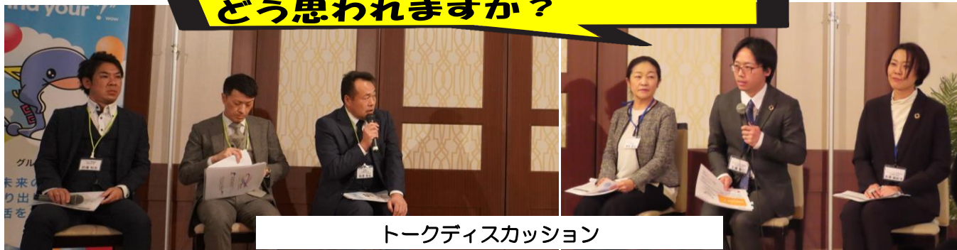
トークディスカッション